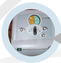
Macchina della tosse

tosse. Va utilizzata quando le tecniche di assistenza alla tosse manuali (la spinta sottodiaframmatica e il reclutamento polmonare) non sono sufficienti ad aumentare l'efficacia della tosse.